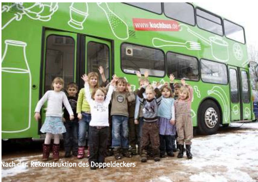
Nach der Rekonstruktion des Doppeldeckers

Ab dem 01. Februar 2008 gilt es, nun die inhaltlichen Ziele umzusetzen. Fehlernährung und Übergewicht haben zu einem dramatischen Anstieg von Diabetes, Bluthochdruck und Kreislauferkrankungen geführt. Wir stehen für eine gesunde Ernährung und wollen mit unserem Projekt Kindern, Jugendlichen und Senioren zeigen, welche Fehler man bei der Ernährung vermeiden sollte, wie eine zeitgemäße Ernährung aussieht und wie „Essen und Trinken“ wieder zum Genuss wird und nicht nebenbei, zu schnell, zu unüberlegt und ohne Spaß und Freude „erledigt“ wird.